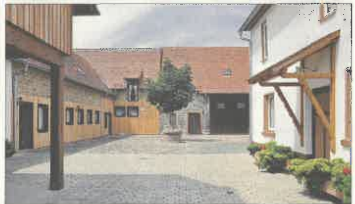
Heimatmuseum in Leeheim

Grundsätzlich können an dem Abend alle gewünschten kommunalen Themen aus der Bevölkerung angesprochen werden. Wenn eine umfassende Diskussion und Erläuterung des Verwaltungshandelns gewünscht wird, sollte das Anliegen nach Möglichkeit vorher telefonisch oder per E-Mail beim Bürgerservice der Stadtverwaltung (Ute Schneider, Telefon 06158 181-131, E-Mail: service@riedstadt.de ) angekündigt werden. Nur so kann sichergestellt werden, dass ggf. vorhandene Akten oder Pläne an dem Gesprächsabend zur Verfügung stehen. Eine Anmeldung der Teilnahme ist im Übrigen nicht erforderlich.