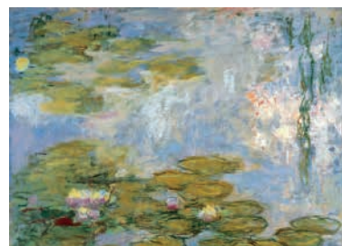
Seerosen, Claude Monet

Eine detaillierte Reisebeschreibung senden wir gerne auf Anfrage zu.