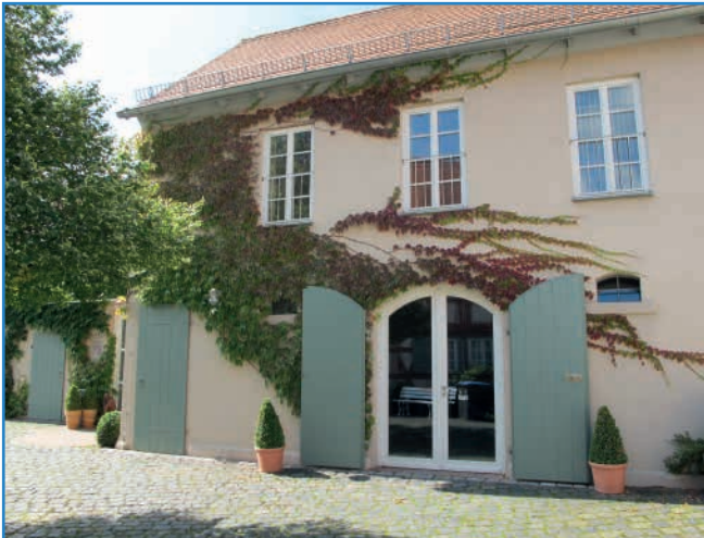
Kulturbüro und Kunstgalerie am Büchnerhaus

Informationen zu allen Veranstaltungen sowie Ausschreibungsunterlagen erhalten sie im