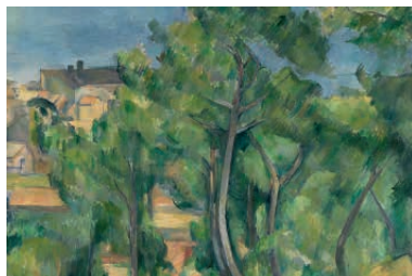
Blick auf das Meer bei L'Estaque Paul Cézanne, 1883 – 1885

Große Sonderausstellung des Landes Baden-Württemberg 28. Oktober 2017 – 11. Februar 2018