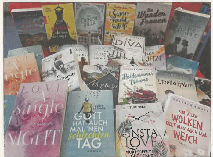
Eine Auswahl der gespendeten Liebesromane.

Alle Stadtteilbüchereien sind ab Montag, 30. August (Erfelden von 10:00 bis 12:00 Uhr, Goddelau von 16:00 bis 18:00 Uhr) bzw. Dienstag, 31. August (Crumstadt und Leeheim von 10:00 bis 12:00 Uhr, Erfelden 15:00 bis 17:00 Uhr und Wolfskehlen 16:00 bis 18:00 Uhr) wieder geöffnet.