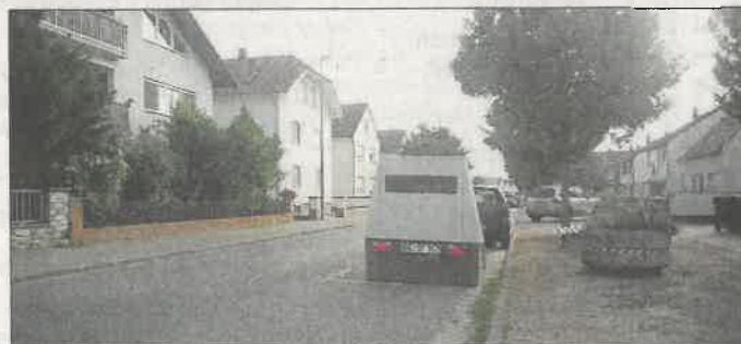
Semistationäre Geschwindigkeitsmessung in der Heinrich-Heine-Straße Wolfskehlen