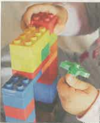
Demnächst werden Plätze frei in der U3-Betreuung