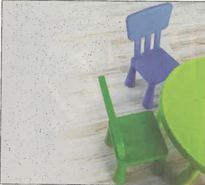
Ab Sommer 2018 gibt es wieder freie Plätze in den Kindertagesstätten

Die Stadtverwaltung bittet die Eltern, sich für eine Einrichtung zu entscheiden und Doppelanmeldungen zu vermeiden. Bei Fragen stehen die Leitungen der einzelnen Einrichtungen gerne zur Verfügung.