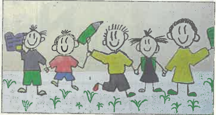
Stadt Riedstadt bietet im Sommer freie Betreuungsplätze für Grundschulkindern

Anmeldeschluss für die Vergabe der Plätze ist Mittwoch, 31. Januar 2018. Anmeldungen, die später abgegeben werden, können nur nachrangig berücksichtigt werden. Die Eltern werden bis Ende März schriftlich über die Aufnahme informiert.