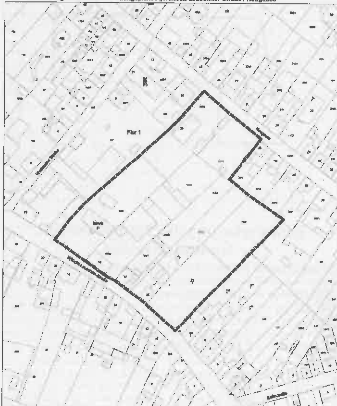
Räumlicher Geltungsbereich des Bebauungsplanes „Wilhelm-Leuschner-Straße / Neugasse“