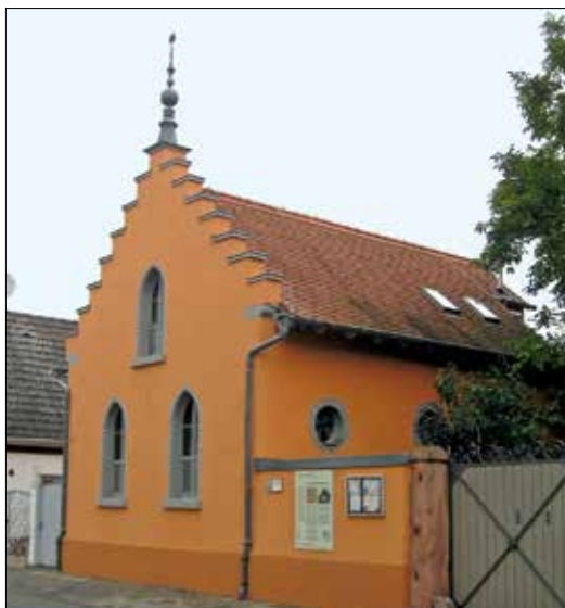
Die ehemalige Synagoge Erfelden.

Im 20. Jahrhundert hinterließen die beiden Weltkriege, Nazidiktatur und die Judenverfolgung sowie die Flüchtlingsströme nach Ende des Zweiten Weltkrieges tiefe Spuren auch in den Riedgemeinden. Das vor 1933 so reichhaltige, florierende jüdische Leben in den fünf Orten wurde brutal zerstört, die