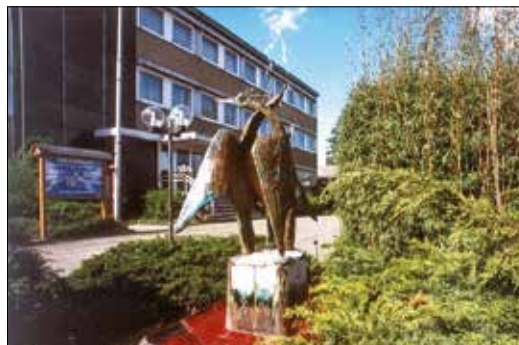
Das alte Rathaus in Goddelau vor dem Ausbau