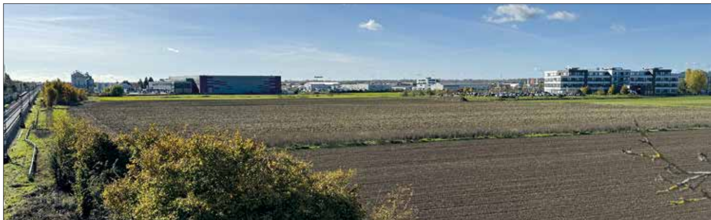
Blick auf den Gewerbepark Ried