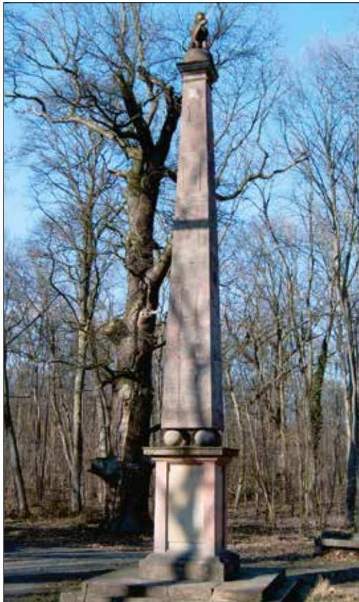
Die Schwedensäule am Altrhein in der Knoblochsau.

helm-Leuschner-Straße. Das Haus gibt es bis heute, eine Plakette an der Hausfassade erinnert an den illustren Gast.