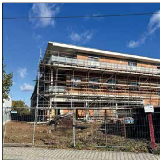
Im Gewerbepark Ried wird weiterhin viel gebaut.

Neben dem Wirtschaftsförderer in der Stadtverwaltung ist der Gewerbeverein Riedstadt eine hilfreiche Anlaufstelle für Unternehmerinnen und Unternehmer. Der Gewerbeverein Riedstadt ist sehr aktiv in der Büchnerstadt und immer ansprechbar. Unternehmerabende oder andere informative Veranstaltungen bieten Raum für Vernetzung und Gespräche. Wer Mitglied werden möchte oder Fragen hat, findet die Kontaktdaten auf der Webseite des Gewerbevereins: www.gewerbeverein-riedstadt.de .