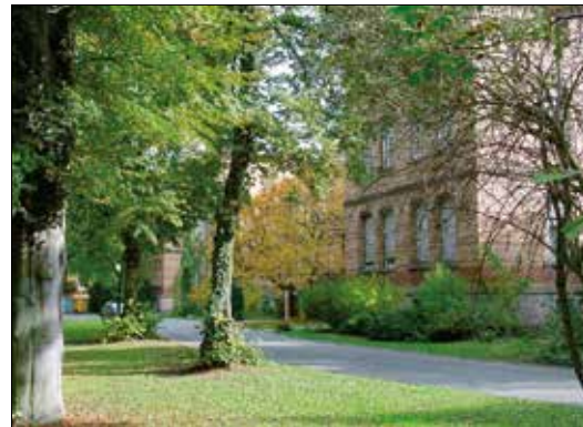
Vitos Riedstadt liegt in einem weitläufigen, parkähnlichen Gelände.

Das Spital war auch ein großer landwirtschaftlicher Betrieb, in dem die Kranken soweit möglich mitarbeiteten. Sei es auf den umliegenden Äckern oder in der eigenen Bäckerei, Weberei, Korbflechtere, Bierbrauerei oder Schmiede. Auch Viehzucht wurde betrieben. Im Dreißigjährigen Krieg wurde das Hospital gleich drei Mal überfallen und die Hospitalkasse geplündert.