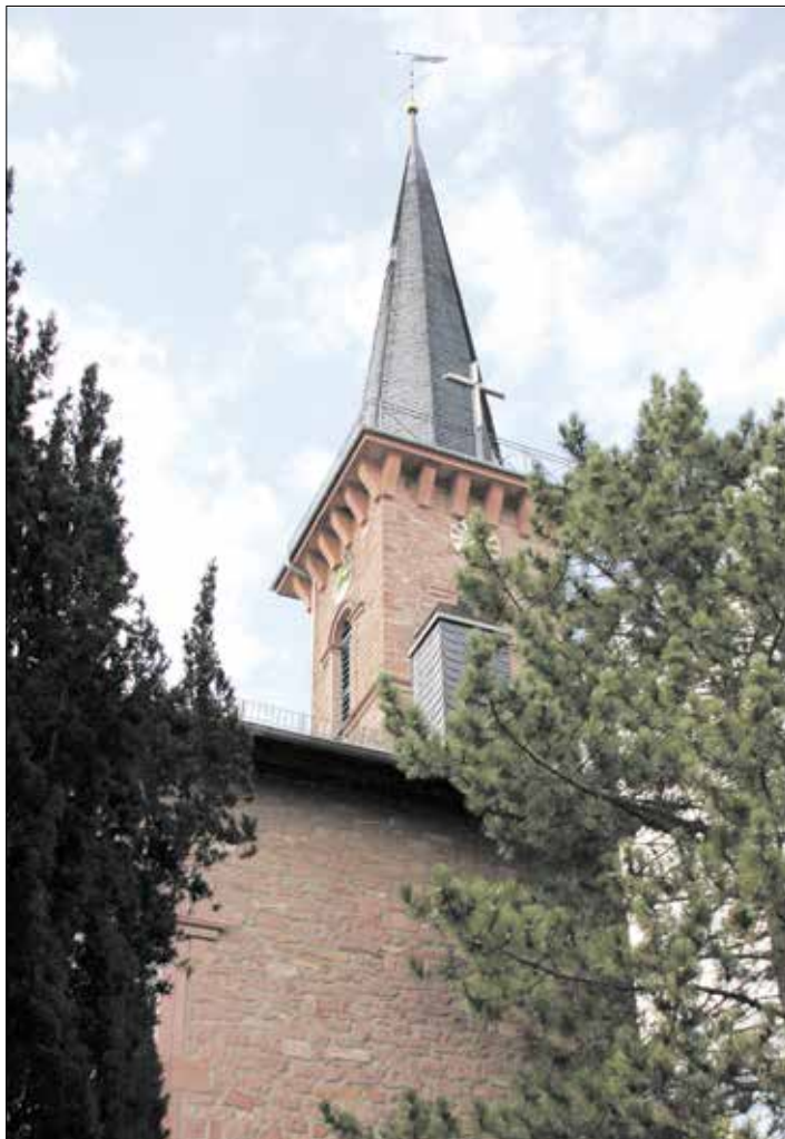
Evangelische Kirche in Erfelden

um das Philipppshospital wieder zu katholischen Gottesdiensten in der Hospitalkirche versammeln. 1925 wurden die Katholiken von Goddelau, Crumstadt, Erfelden und Wolfskehlen in der Pfarrkuratie Griesheim zusammengefasst. 1932 erwarb die neu gegründete Kirchengemeinde Goddelau für ein eigenes Gotteshaus ein Grundstück, am 6.9.1937 wurde die kleine Kirche dem Hl. Bonifatius geweiht. Durch den Zuzug von ca. 700 katholischen Heimatvertriebenen nach dem Zweiten Weltkrieg vergrößerte sich die Gemeinde schlagartig. 1953 wurden die vier Ortschaften Crumstadt, Goddelau, Erfelden und Wolfskehlen zur kath. Pfarrkuratie Goddelau/St. Bonifatius zusammengefasst und von Griesheim getrennt. Seit November 2002 gehört auch der fünfte Riedstädter Stadtteil Leeheim mit der 1987 errichteten Albanskirche zur Pfarrgemeinde. Nähere Informationen gibt es auf der Internetseite www.bistummainz.de/pfarrei/riedstadt