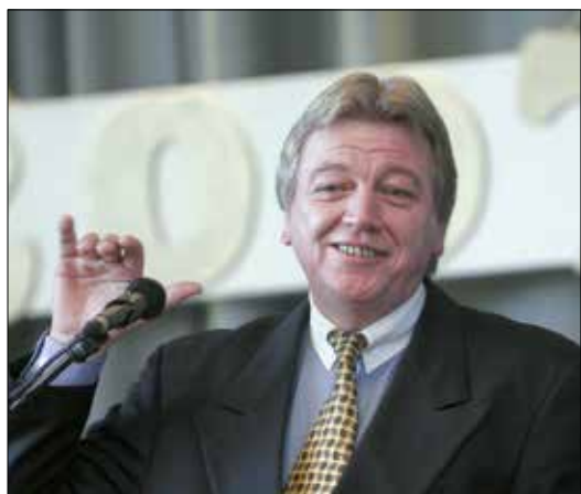
Der damalige Hessische Innenminister Volker Bouffier bei der Überreichung der Stadt-Urkunde 2007