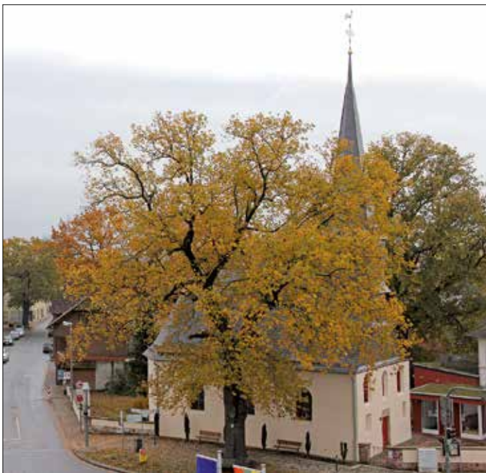
Evangelische Kirche in Goddelau

Im protestantisch geprägten Großherzogtum durften sich seit Januar 1851 erstmals nach der Reformation katholische Christen aus den Dörfern rund