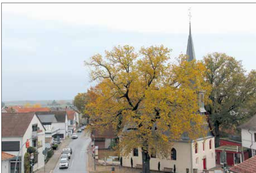
Schwedensäule Leeheim; Ökomarkt in Erfelden; Kinderfest in Goddelau; Evangelische Kirche Goddelau.