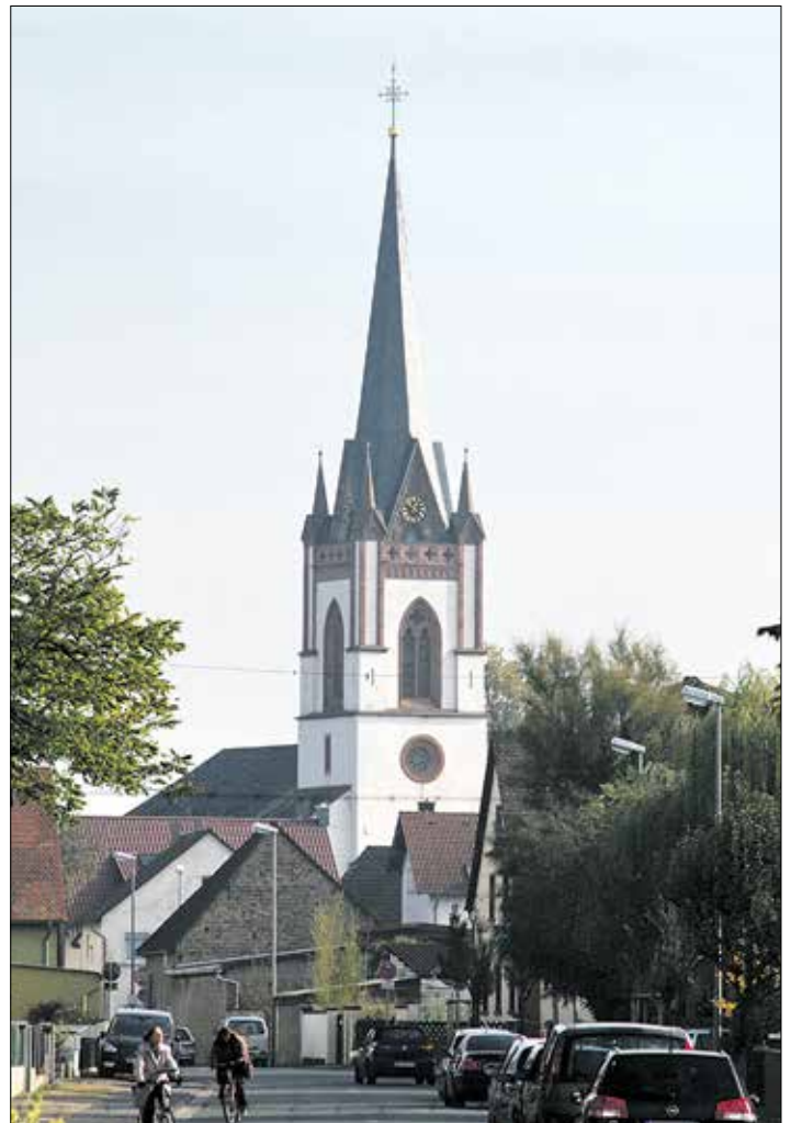
Evangelische Kirche in Wolfskehlen

Die Ahmadiyya Muslim Jamaat (Gemeinde) ist eine friedliche Reformgemeinde innerhalb des Islams. Das Motto der Ahmadiyya Jamaat lautet: „Liebe für alle, Hass für keinen“ und „Der Islam heißt Frieden.“ Am 30. August 2004 wurde die Aziz Moschee in Anwesenheit des 5. Kalifen und Oberhaupt der weltweiten Ahmadiyya Muslim Gemeinde, Hadhrat Mirza Masoor Ahmad, feierlich eröffnet. Die zwei Gebetsräume der zweistöckigen Moschee bieten Platz für 400 Betende. Die Aziz Moschee hat ein 14 Meter hohes Minarett und eine Kuppel. Weitere Informationen unter www.ahmadiyya.de/gebetsstaette/moscheen/riedstadt-goddelau