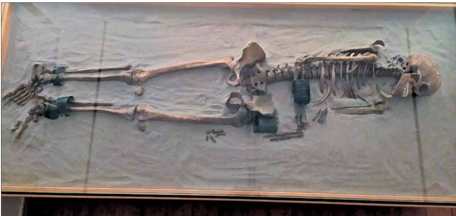
Die „Frau vom Sand“, das Skelett einer jungen Frau aus der mittleren Bronzezeit, wird im Heimatmuseum Crumstadt ausgestellt.

Der Dreißigjährige Krieg (1618 – 1648) traf Südhessen mit voller Wucht. Kriegshandlungen und damit einhergehende Verwüstungen, Hungersnöte und die Pest sorgten dafür, dass der Landstrich verödete. Historiker schätzen die Bevölkerungsverluste auf 60 bis 80 Prozent. So berichten Heimatforscher, dass in Wolfskehlen nahezu die gesamte Bevölkerung ausgelöscht wurde, in Leeheim blieben von 113 Häusern nur 30 stehen – und dann kam die Pest. Eine militärische Meisterleistung wurde im Dezember 1631 von Erfelden aus gestartet: Für den Gegner völlig überraschend setzte Schwedenkönig Gustav Adolf mit seinen Truppen von hier aus über den Rhein und nahm erst Oppenheim und dann Mainz ein. In Erinnerung an diesen wichtigen Sieg ließ Gustav Adolf am heutigen Altrhein die Schwedensäule errichten. Der Schwedenkönig übernachtete im Erfelder Bürgermeisterhaus in der heutigen Wil-