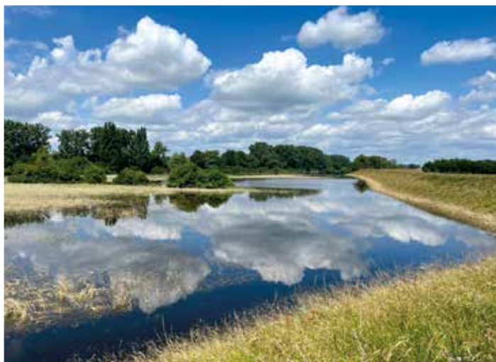
Überflutete Stromtalwiesenlandschaft in der Gemarkung Erfelden.