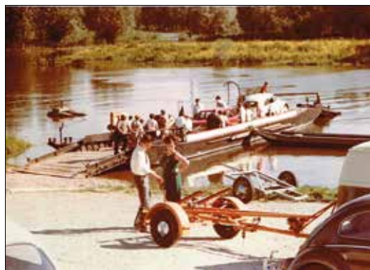
Die Erfelder Fähre in den 60er Jahren