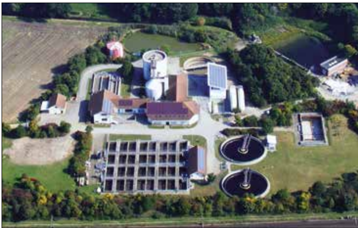
Die Zentralkläranlage in Goddelau