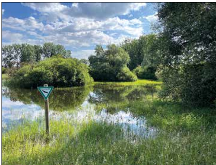
Naturschutzgebiet Riedwiesen von Wächterstadt.

gen dort auf die Kreisstraße Richtung Leeheim ab. Nach 1,3 km nehmen wir dann den Feldweg weiter in südliche Richtung über den Golfplatz am Hofgut Hayna mit den Moai-Figuren (steinerne Figuren der Osterinseln). Von dort biegen wir dann wieder auf die Kreisstraße nach Wolfskehlen ab und gelangen wieder zum Bahnhof.