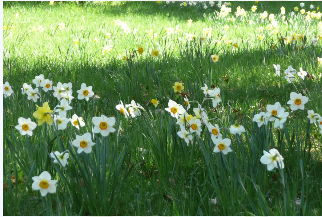
Rasenfläche mit Blumenzwiebeln: attraktiv und pflegeleicht

Ergänzend dazu sollen beschädigte und kranke Bäume ersetzt werden. Das bedeutet, dass umfangreiche Arbeiten durchgeführt werden müssen: