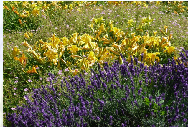
Pflegeleichte und attraktive Pflanzung mit Stauden (gelben Taglilien, rosa Storchschnabel) und Halbsträuchern (violetter Lavendel).

Alle Anlieger sind herzlich eingeladen, eine Patenschaft für die Pflege von Grünflächen zu übernehmen. Die Rahmenbedingungen dazu werden in Patenschaftsverträgen einvernehmlich festgelegt. Bei Interesse wenden Sie sich bitte an die Stadtverwaltung Riedstadt.