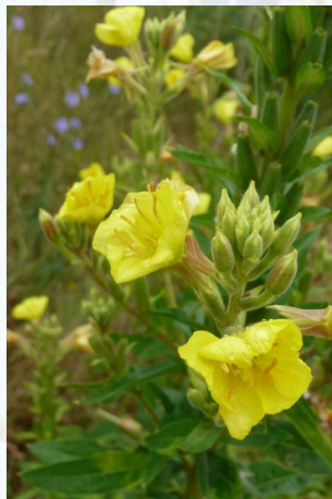
Natternkopf (links) und Nachtkerze, zwei typische Arten trocken-warmer Standorte, attraktiv, anspruchslos, pflegeleicht. Arten wie diese werden auf den mageren Blumenwiesenbeständen anzutreffen sein.

Flächen, die sich bereits derzeit in einem guten Zustand befinden oder mit geringem Pflegeaufwand in einen solchen überführt werden können, sollen erhalten bleiben.