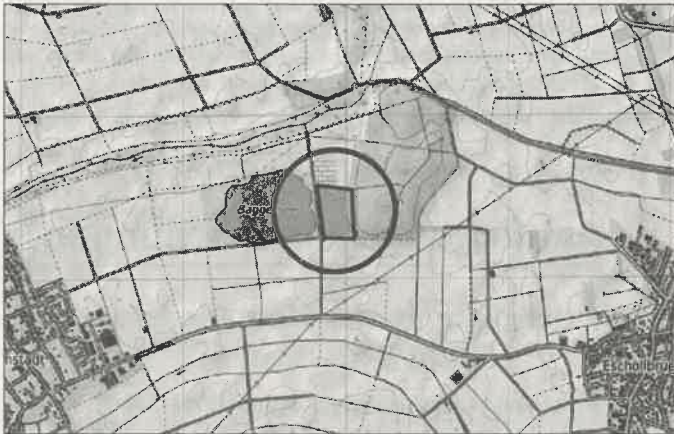
Räumlicher Geltungsbereich des Bebauungsplanes „Anglerhütte SFV Waldsee“