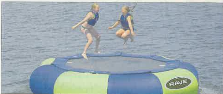
Mit Crowdfunding erreichbar: Ein Wassertrampolin fürs Goddelauer Freibad

Spender werden auf der Homepage mit Namen aber ohne Geldbetrag genannt, können aber auch anonym bleiben. Spendenquittungen werden auf Wunsch zugesandt. Mit weniger Klicks hat man schnell ein gutes Werk für das „Goller Schwimmbad“ getan. Wer sein Geld lieber bar loswerden möchte, kann das mit einem leckeren Cocktail verknüpfen. Beim Cocktailabend im Freibad Goddela am Freitag, 8. Juli ab 17:30 Uhr werden die Trampolin-Spenden auch direkt angenommen und später auf das Crowdfunding-Konto überwiesen.