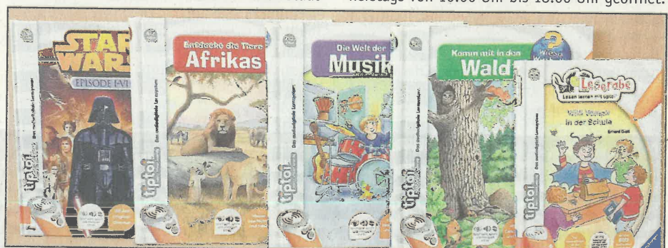
Die tiptoi®-Reihe des Ravensburger Verlags

teilibücherei in Crumstadt, Poppenheimer Straße 1 ausleihen, der nötige Stift muss vom Leser selbst angeschafft werden. Weitere Informationen zu diesen und weiteren Neuanschaffungen erteilt die Büchereileitung unter 06158 915513. Die Bücherei in Crumstadt im alten Rathaus hat dienstags von 10:00 Uhr bis 12:00 Uhr und donnerstags von 16:00 Uhr bis 18:00 Uhr geöffnet.