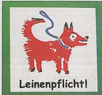
Leinenpflicht auch im Außenbereich

Die Hundehalter sind nach § 11 der Hundesteuersatzung verpflichtet, die Hunde „mit einer gültigen und sichtbaren Hundesteuermarke zu versehen“, sobald sie das eigene Gelände verlassen. Diese Steuermarke wird vom städtischen Steueramt bei der Hundeanmeldung ausgegeben. Die städtischen Kontrollen schließen auch die Einhaltung der Riedstädter Straßenordnung mit ein. Demnach sind Hundehalter verpflichtet, die von Hunden verursachten Verschmutzungen von öffentlichen Verkehrsflächen unverzüglich zu beseitigen. In § 4 Abs. 3 der Satzung heißt es außerdem „Wer einen Hund führt, hat ein für die Aufnahme von Hundekot geeignetes Behältnis mitzuführen.“